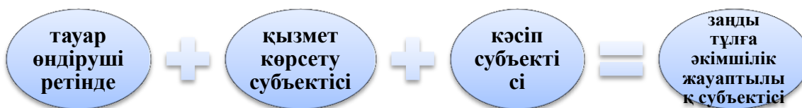
Сурет 1. Заңды тұлғалар әкімшілік жауаптылық субъектісі ретінде

Заңды тұлғаларды автор жауаптылық субъектісі ретінде үш қырынан көрсетеді (сурет 1.).